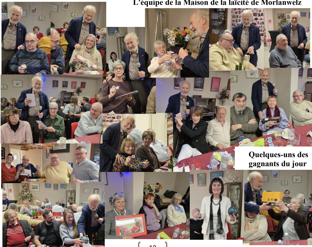
Quelques-uns des gagnants du jour

Rendez-vous en 2026 pour de nouvelles activités et rencontres à la Maison de la laïcité ! L'équipe de la Maison de la laïcité de Morlanwelz