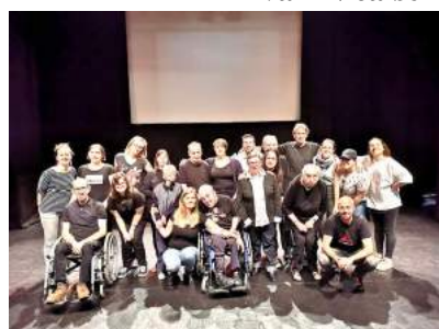
Les acteurs de « La cité idéale » sur la quête de l'utopie