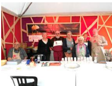
La sympathique équipe de notre Maison de la Laïcité

Quelques photos illustrent ces journées durant lesquelles notre Maison de la Laïcité avait tenu le bar de « La Hic ».